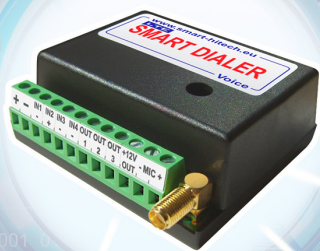
SMART DIALER LTE Voice